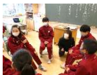
6年2組 国語「つないでつないで一つのお話」