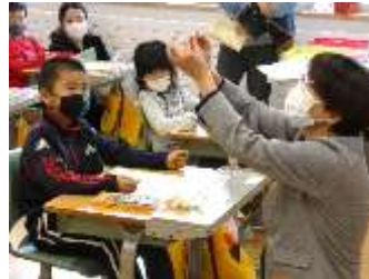
2年1組 図工「じぶんのかおをかこう」