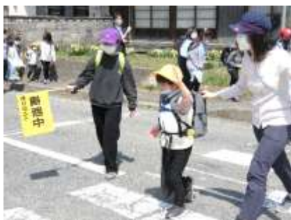
全校一斉下校指導

新年度となる4月には、安全に関する学習や体験が続きました。4月11日(月)には、1年生を含めた集団登下校のきまりやマナーの確認をする全校一斉下校指導。20日(水)には、駐在所長さんや交通指導員の方々を講師に、正しい道路歩行や自転車の乗り方を学ぶ交通安全教室。26日(火)には、消防署員の方々も来校され避難訓練が行われました。学校で、子どもたちは様々なことを学びますが、「命を守る学習」が最も大事だと考えます。ご家庭でも、交通事故防止、災害時の対応等について、お子様への指導と家族間での確認をお願いします。