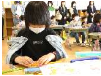
1年2組 算数「なかまづくりとかず」