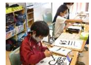
まなびⅡ組 書写「毛筆のきほん」

学習参観後の学年懇談会では、今年度の学年経営方針の説明や学級役員選出を行いました。令和3年度に役員を務めて下さった皆様には、心から感謝いたします。新役員の皆様、どうぞよろしくお願いいたします。