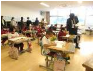
4年1組 国語「白いぼうし」