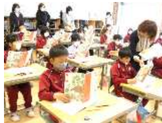
4年2組 国語「白いぼうし」