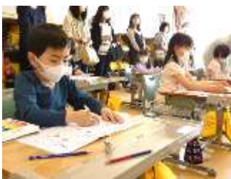
1年1組 国語「うたにあわせてあいうえお」

今年度も、感染症予防対策として参観日を2回に分け、4月15日(金)は2・4・6年生の、21日(木)は1・3・5年生の学習参観が行われました。どの学級も、お家の人に見られる緊張感の中にも、張り切って授業をしている様子が見られました。その後の、学年懇談会にも多数ご出席いただきありがとうございました。今後も、子どもたちの健全育成のために、ご家庭との共通理解と連携を大切にしていきます。どうぞよろしくお願いいたします。