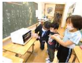
まなびⅠ組 生活単元学習「お祝いの会をしよう」