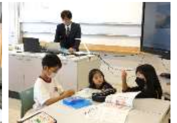
5年2組 家庭科「針と糸を使って」