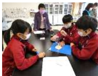
6年1組 理科「物の燃え方と空気」