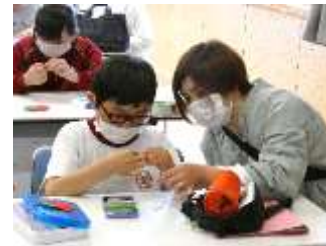
5年1組 家庭科「針と糸を使って」