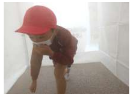
避難訓練(4年煙体験)